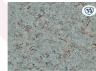
CUBIERTA ORIGINAL WHITE JUPARANA